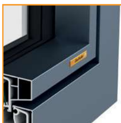
Design alluminio PLANE

Valori U_w calcolati secondo EN 10077-1, finestra 1 anta, 1 battente, dimensioni elemento 1230 x 1480 mm, profilo bianco entrambi i lati. Impiego di ulteriori controventature in telaio a scomparsa e battente, a seconda dei requisiti indicati, come struttura, tipologia costruttiva, dimensioni e requisiti statici.