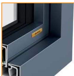
Design alluminio standard PURE

Grazie al resistente ed omogeneo incollaggio PowerBond del vetro con il telaio battente, il battente mantiene la sua forma iniziale. Grazie ad una tecnica di incollaggio innovativa mantiene la forma ed è resistente alla torsione.