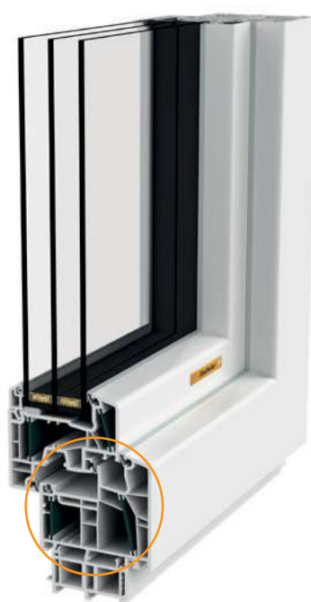
ENERGYLINE-E 85 PVC