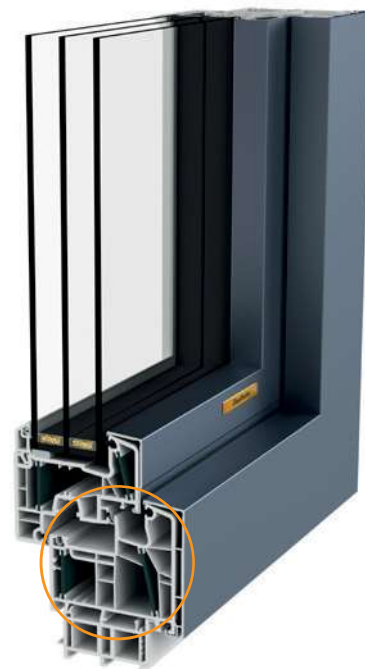
PVC-ALLUMINIO ENERGYLINE-E 91 PURE