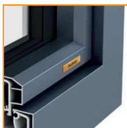
Design alluminio SOFT

Il rivestimento complanare in alluminio PLANE conferisce alla sezione esterna la massima linearità: sobria e planare.